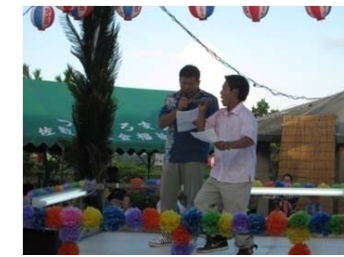
司会名コンビの誕生日

平成二十六年七月二十六日（土）夏の風物詩「第35回東雲の丘納涼まつり」が盛大に開催され、総勢六百五十名の参加者となり過去最大の盛況ぶりでした。 南城市老人会・婦人会の各支部による色とりどりの踊り、障がい者支援施設 鶴生の利用者による今流行りのダンス。地域住民ボランティアによるフラダンス等の余興で会場を盛り上げて下さいました。