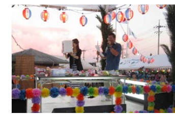
豪華賞品抽選会の様子