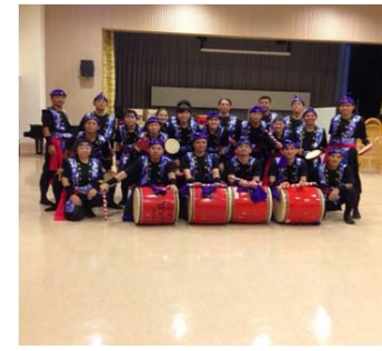
東雲の丘エイサークラブ

加えて東雲の丘職員は、外国人介護福祉候補者による（インドネシア共和国、フィリピン共和国の二国が各々の国のお祝いダンスを披露し、国際色豊かな時間となりました。 最後に、東雲の丘職員のニール、ネーネー達で構成するエイサークラブによる踊りを披露！ 会場は大盛り上がりでした。