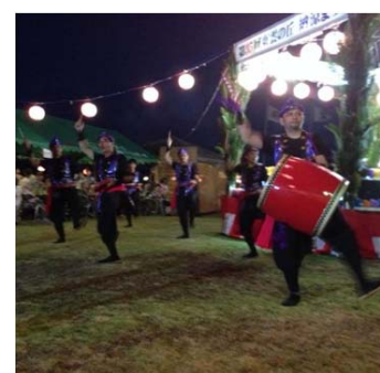
東雲エイサーのスナップ