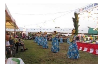
フラダンスア・ケパ・フラサークルの皆様