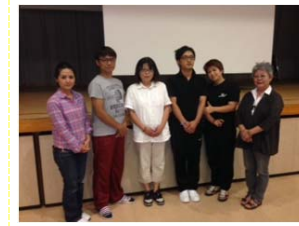
ユニットリーダー実地研修受講者と施設職員

8月は学校教員の皆様や大学生、他施設職員と数多くの方が東雲の丘で学びました。 高齢者福祉に興味のある方、要望があれば気軽に相談下さい。東雲の丘で共に学び高齢者を支えよう