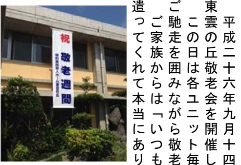
9月の第2週！東雲の丘では敬老週間と位置づけ大きな垂れ幕を掲げお祝いしています。

平成二十六年九月十四日(日)十二時から東雲の丘敬老会を開催しました。この日は各ユニット毎に、ご家族を招待しご馳走を囲みながら敬老のお祝いをしました。ご家族からは「いつも、私たちのことを気遣ってくれて本当にありがとう」「くれぐれも健康に気をつけてください。」「等のあいさつがご家族毎にありました。遠くから見るその光景は、笑顔のご家族に囲まれ、誇らしい姿と感じました。敬老会は敬老愛。ご家族に愛されている高齢者の尊厳を私達は守ることを使命だと改めて実感し遣り甲斐のある職種であると再認識しました。