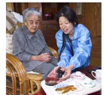
普段の何気ないあいさつ、会話も大切な支援と考えています。高齢者に関することは何でもお気軽にご相談下さい。

配食サービス事業を通し、高齢者の安否及び異常の早期発見、連絡体制を強化します。平成二十六年九月十七日(水)午後二時、南城市市役所大里庁舎で南城市地域見守りネットワーク事業の協定締結がありました。この事業は南城市が中心となり地域高齢者、障がい者、その他見守りを必要とする方の安否及び異常の早期発見並びに早期対応に向けた連絡体制を強化を目的とします。市に根差した商店・スーパー・企業等に安否確認のための連絡体制と南城市に根差した商店・スーパー・企業等に 配食サービス事業を通し、高齢者の安否及び異常の早期発見、連絡体制を強化します。平成二十六年九月十七日(水)午後二時、南城市市役所大里庁舎で南城市地域見守りネットワーク事業の協定締結がありました。この事業は南城市が中心となり地域高齢者、障がい者、その他見守りを必要とする方の安否及び異常の早期発見並びに早期対応に向けた連絡体制を強化を目的とします。市に根差した商店・スーパー・企業等に安否確認のための連絡体制と南城市に根差した商店・スーパー・企業等に 配食サービス事業を通し、高齢者の安否及び異常の早期発見、連絡体制を強化します。平成二十六年九月十七日(水)午後二時、南城市市役所大里庁舎で南城市地域見守りネットワーク事業の協定締結がありました。この事業は南城市が中心となり地域高齢者、障がい者、その他見守りを必要とする方の安否及び異常の早期発見並びに早期対応に向けた連絡体制を強化を目的とします。市に根差した商店・スーパー・企業等に安否確認のための連絡体制と南城市に根差した商店・スーパー・企業等に