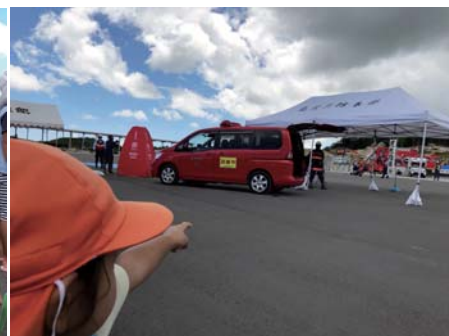
「たいへん！人がたおれているよ～」