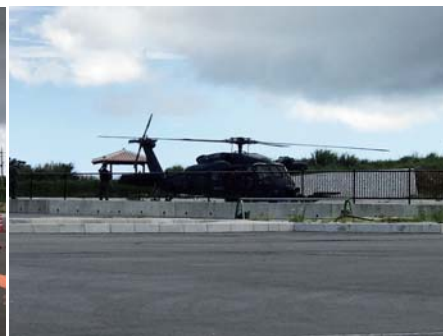
「ヘリコプター到着！」