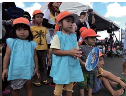
「ケガしているけどだいじょうぶかな～」