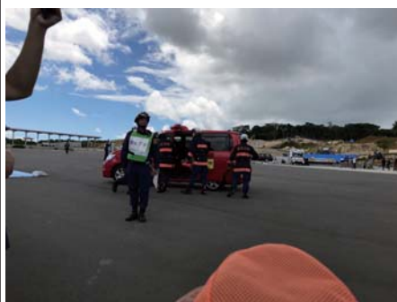
「今から救助活動を行います」