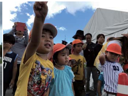
「みてみて！くるまがひっくりかえってるよ～！」