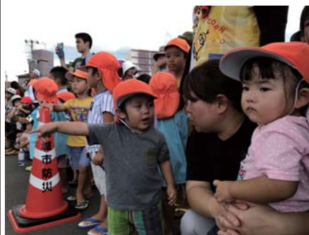
「せんせーしょーぼーしゃー」

帰園後は、保育士から災害の話しを行い、皆で協力する大切さを子ども達と振り返りました。