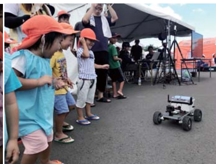
「うわあ！ちかづいてきた！」