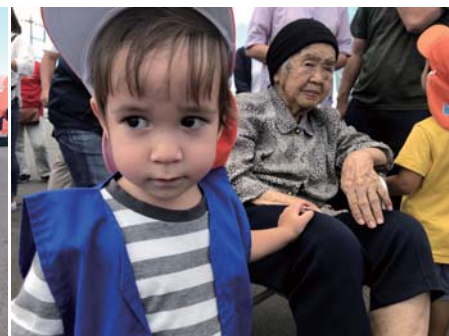
「おばあちゃんといっしょならあんしん！」