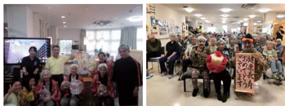
健康チェック・食事・入浴・リハビリ・レクリエーション・季節ごとの楽しい行事を日帰り楽しんでいただけます。